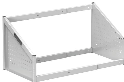
Stolní stojan 54 x 27D