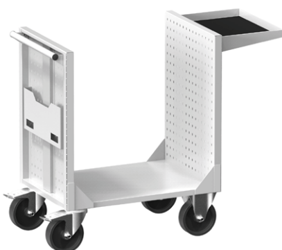
Vozík 36 x 27D

Základní barevné provedení Barevnost korpusu RAL 7035 je použita v případě, že v objednávce není uvedena požadovaná barevnost.