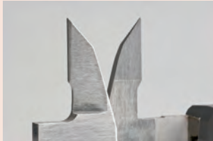
Měřicí čelisti pro vnější/vnitřní měření osazené tvrdokovem Obj. č. 505-735