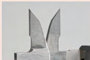
Měřicí čelisti osazené tvrdokovem