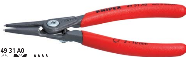
49 31 A0 MM