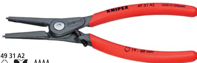
49 31 A2 MM