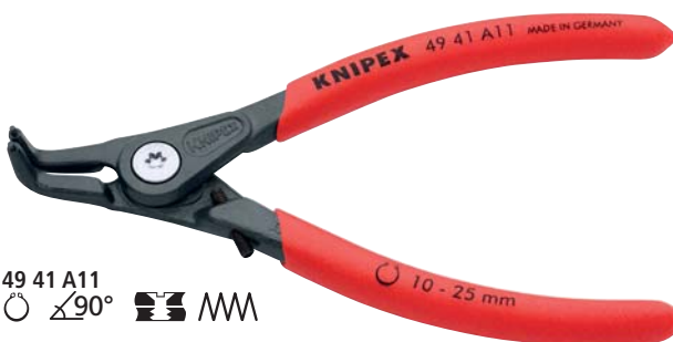
49 41 A11 MM