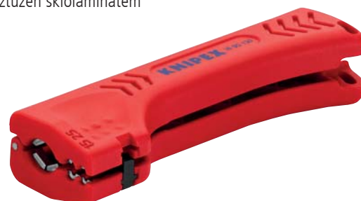
16 90 130 SB M