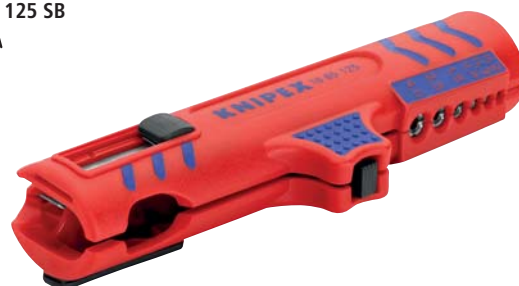
16 85 125 SB M