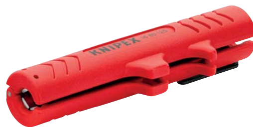
16 80 125 SB M