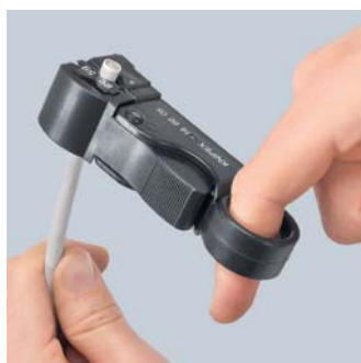
Třístupňový řez v jedné pracovní operaci