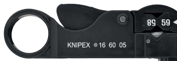
16 60 05 SB MM