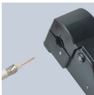
Vnitřní vrstvy jednotlivě uloženy