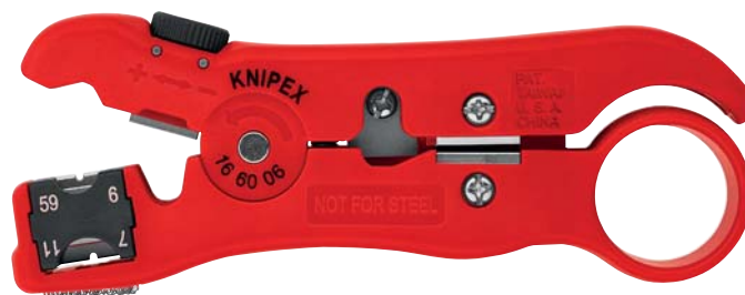
16 60 06 SB MM