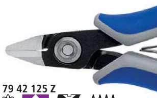
79 42 125 Z