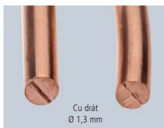
Stříh kleštěmi 79 42 125 (bez fasety)

špičatá hlava; s drátěnou svěrkou – žádné nekontrolované odskakování odštížků drátů