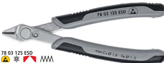
78 03 125 ESD ⚡ ✳️ ▲ ▲ ▲