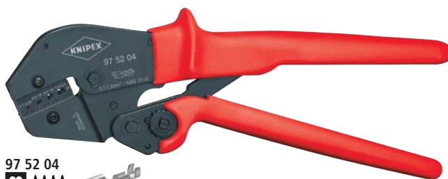
97 52 04 MM