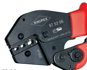
97 52 06 MM