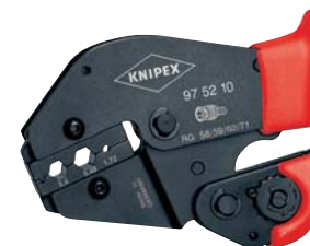
97 52 10 MM

Třetí krok: pokud je zapotřebí větší síla např. u izolovaných spojek 6,00 mm 2 je díky delším rukojetím možné pracovat oběma rukama