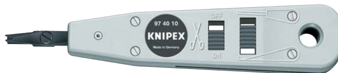
97 40 10