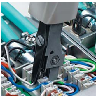
Vtlačení a ustřížení kabelu v jedné pracovní operaci