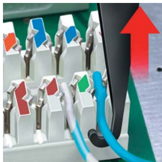
S integrovaným tažným hákem