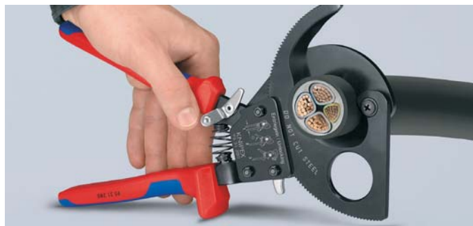
95 31 250/280: Potah pevného ramena s opěrnou plochou pro možnost opření při řezu