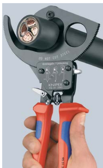
Princip rohatky se západkou a dvoustupňový pohon ozubeným věncem pro stříhání šetřící síly