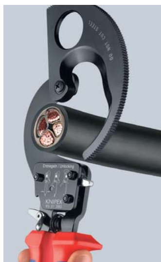
95 31 280: velká kapacita: max. Ø 52 mm / 380 mm 2